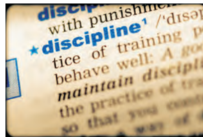
When a school seeks to discipline a student, there are certain rules and procedures they must follow.

All schools must have policies that explain to parents and students how they expect students to behave, the consequences of not following the school’s rules, and how to appeal a disciplinary action. These policies are called the code of student conduct . Schools must give the student code of conduct to students and their parents every year. Many schools also post