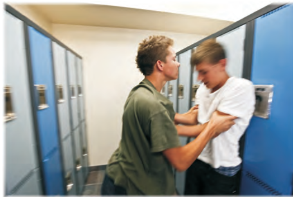
El estudiante podría ser acusado de hostigamiento, intimidación o acoso escolar.

Existen dos tipos de suspensiones. Una suspensión de corta duración es cuando un estudiante es suspendido de la escuela por 10 días escolares consecutivos o menos. Una suspensión de larga duración , es cuando un estudiante es suspendido por más de 10 días escolares consecutivos. Si su hijo es suspendido, es importante que usted comprenda la diferencia entre estos dos